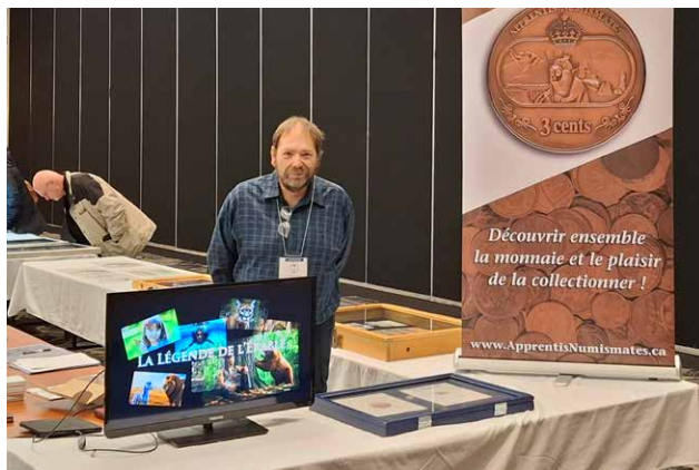
Salon numismatique de Drummondville - février 2026

Tout d'abord l'annonce de la huitième édition de notre Concours Littéraire sous le thème de la musique. Va vite découvrir les critères qui te permettront, peut-être, de te mériter un prix et voir ton récit illustrer sur une médaille.