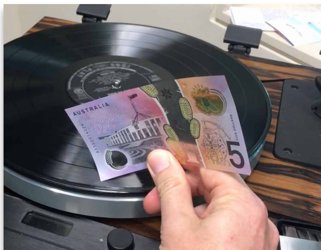
Billet australien utilisé pour écouter de la musique

Pour le numismate passionné, rechercher, découvrir et collectionner ces pièces, c'est un peu comme composer sa propre partition de l'histoire culturelle mondiale. Chaque pièce devient une note, chaque série une mélodie.