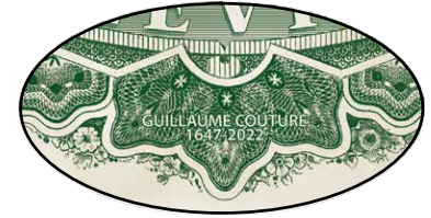
Clin d'oeil à Guillaume Couture

Le dos du billet est simplement actualisé pour rappeler le 150 e anniversaire du dernier fort militaire construit au Québec. Cependant, caché dans les fioritures du bas, on peut découvrir un clin d'oeil au sujet de Guillaume Couture. Il y a 375 ans, il fut le premier colon à s'établir sur la Seigneurie de Lauzon (aujourd'hui Pointe-Lévy) en 1647.