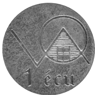
Agrandissement à 200%

Le jeton est fait d'aluminium et mesure environ 20 mm. On y retrouve le logo du Village et l'inscription «1 écu».