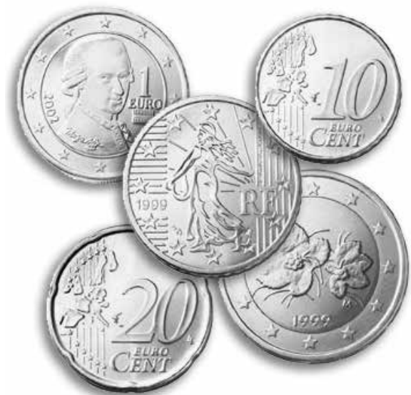
Collaboration de Sébastien Siffritt, France

On peut aussi faire plus d'affaire puisque la comparaison avec les autres pays au niveau des prix est beaucoup plus facile. L'Euro a été très bien accueilli par l'Europe et ses consommateurs. L'Europe se place maintenant au deuxième rang Monétaire mondiale et peut enfin concurrencer le Dollar. L'Euro est donc pour l'instant un succès qui pourrait se concrétiser les années suivantes avec l'entrée d'autres pays telle la Grande-Bretagne.