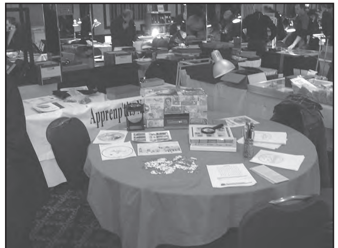
Table des jeunes lors du Salon Nuphilex