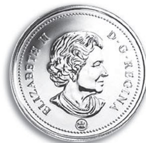
Le 2 dollars a 10 ans

Dans un communiqué de presse la Monnaie nous dévoile les éléments de sa dénomination sociale: la lettre « M » qui renvoie au terme « Monnaie »; une feuille d'érable qui symbolise la nature «canadienne» de l'entreprise et une couronne qui renvoie aux termes « royale » et « société d'État ». Par leur forme conique, leur positionnement et leur espacement, les deux composantes de la marque évoquent le mouvement de deux coins qui frappent une pièce.