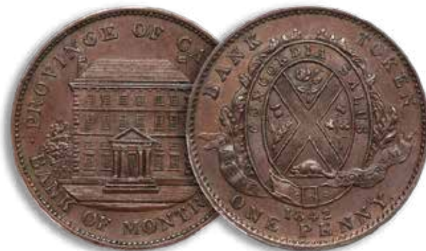
Jeton # 526 - One penny Montreal Bank 1842

Cent jetons ont été produits et remis aux collectionneurs qui nous ont visités. Les quelques jetons restants sont offerts pour 3$, incluant les frais de poste.